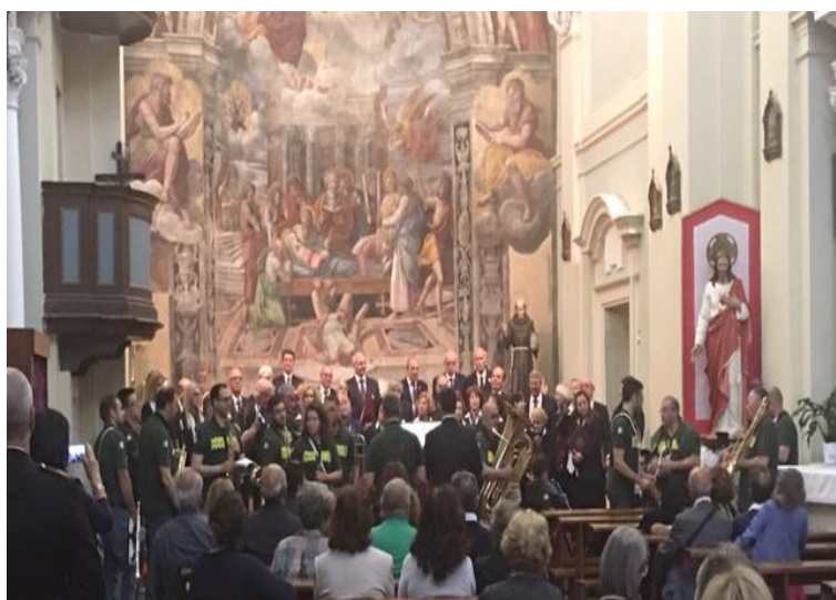
5 Concerto del Coro Polifonico Interforze della Famigli Militare "Salvo d'Aquisto", insieme alla Banda musicale della Città di Accumoli

Per una Comunità celebrare le tradizioni vuol dire unirsi nella storia guardando al futuro... in questa prima cronaca di una due giorni passata insieme alle celebrazioni eucaristiche con Don Gabriel, la comunità dei fedeli e il Vescovo Romano Rossi. Le note fresche e piacevoli della Banda musicale della Città di Accumoli in segno di amicizia e di solidarietà con i bravi musicanti del nostro complesso bandistico, la serata romanesca nel borgo antico ideata dall'associazione "a Trevignano, la prelibatezza del tipico pesce marinato sapientemente preparato e distribuito dall'associazione "il Cormorano", la gara di pesca dell'associazione "guastatori spinning" e i tradizionali giochi per bambini gioiosamente organizzati dall'associazione "quelli de..."... la mostra fotografica sotto il portico della Residenza Comunale che narra i giorni in cui fu portata la salma del Santo Patrono a Trevignano promossa dall'immane gruppo parrocchiale e poi... la straordinaria e appassionata processione del San Bernardino portato in spalla per le vie del paese con la conclusione dei grandi fuochi d'artificio incorniciati nel nostro splendido lago... con l'assistenza di qualche esperto concittadino, della nostra Polizia Locale, dei sempre presenti volontari del gruppo comunale di protezione civile e dei Carabinieri della nostra stazione di comando... Grazie dunque a tutti quelli che si sono dati da fare e soprattutto alle associazioni che si sono prestate. (Luca GALLONI)