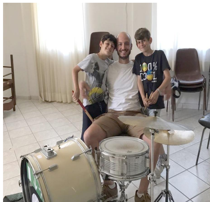
Scuola di Musica – Piccoli musicisti crescono