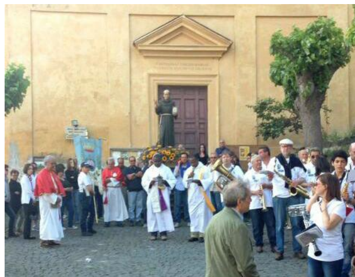
Avvio della Processione religiosa in onore di S. Bernardino